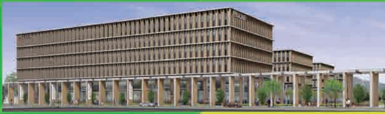
2018年4月 JR草薙駅北口に静岡草薙キャンパス誕生