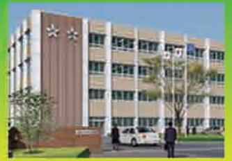
2016年11月末 新校舎完成